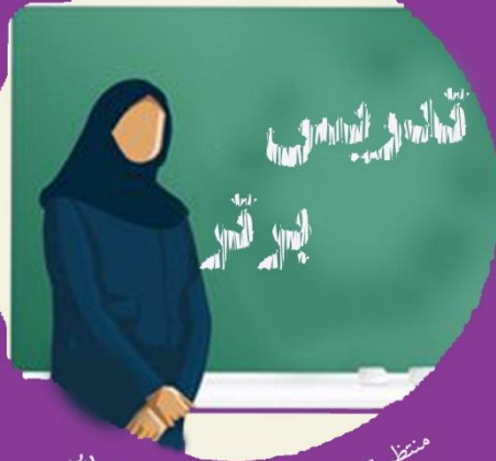
منتظر توضیحات کامل تر هر قسمت در شماره های بعدی نشریه باشید.

۳. جور چین هایی که صدای جدید هم در اول و هم در آخر کلمه آمده است مثل: فیلسوف